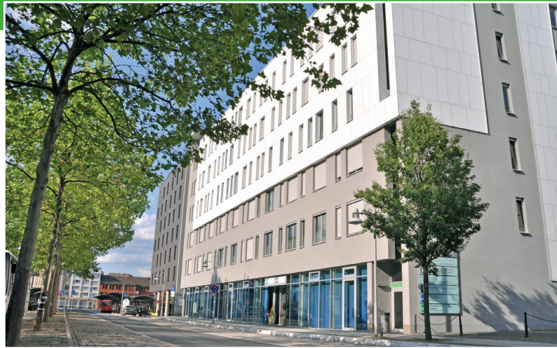
MVZ Koblenz – Neversstraße 7-11 · 56068 Koblenz

Zudem steht die Einrichtung in enger Kooperation mit dem Therapie-Zentrum Koblenz®, ein Rehabilitationszentrum im gleichen Gebäude. Je nach Voraussetzungen, Schweregrad der Erkrankung und Zielsetzung können dabei Schmerzpatienten ambulant (MVZ Koblenz®) oder in der teilstationären Rehabilitation (Therapie-Zentrum Koblenz®) versorgt werden. Zu den häufigsten Schmerzerkrankungen, auf die sich die Einrichtungen im Besonderen spezialisiert haben, zählen: chronische Rückenschmerzen, chronische Kopfschmerzen, Schleudertrauma, CRPS/Morbus Sudeck, neuropathische Schmerzen, Fibromyalgie und somatoforme Schmerzstörungen.